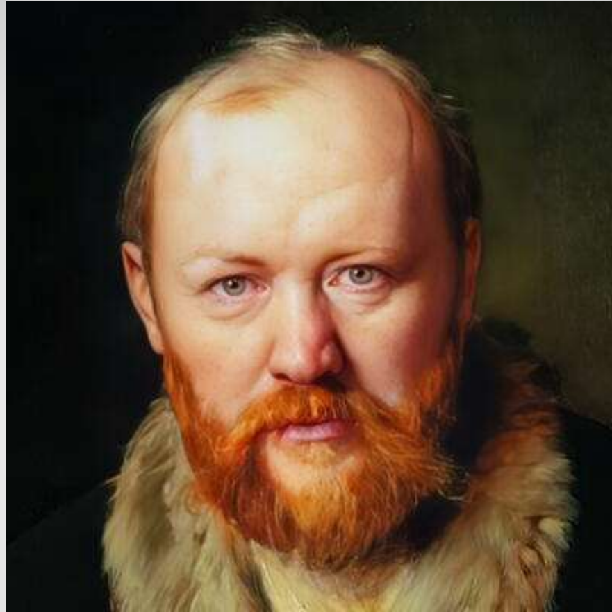
Александр Николаевич Островский 12 апреля 1823 г. - 2 июня 1886 г.