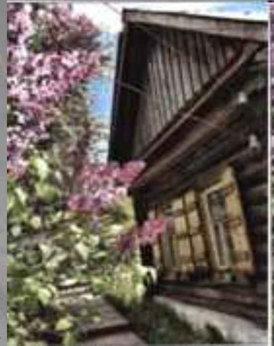
Цветёт сирень у домика Астафьевых

Два года спустя в Перми вышла первая книга — «До будущей весны». 1958 – становится членом Союза писателей СССР.