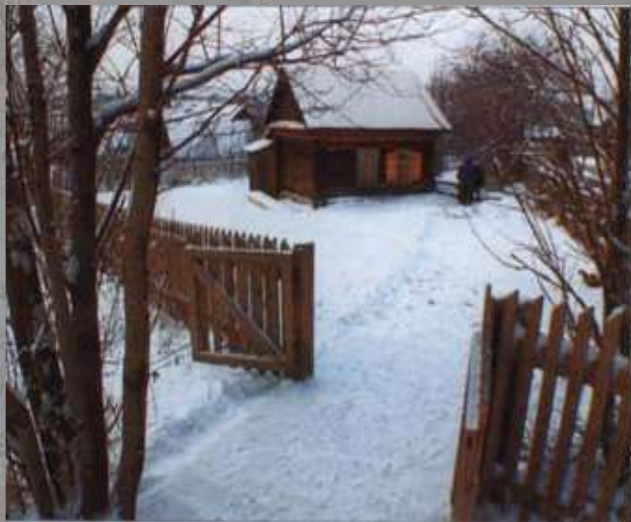
Дом Астафьевых в Чусовом